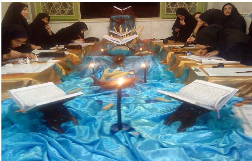
تصویر شماره ۱۳-کتابت جزء سی ام قرآن کریم

۱۴- کتابت جزء سی قرآن که در شب ۲۱ ماه مبارک رمضان سال ۱۴۳۲ قمری مصادف با ۳۰ مرداد ماه ۱۳۹۰ هجری توسط بانوان هنرمند خوشنویس و تذهیب کار انجمن خوشنویسان گلپایگان با حمایت هیئت امنای سقاخانه صورت پذیرفت. پیشنهاد کتابت جزء سی ام قرآن از طرف انجمن خوشنویسان بود که هیئت امنای از این پیشنهاد استقبال کردند. بنابر بر گفته یکی از خادمین سقاخانه، هدف این است که این کار ادامه پیدا کند و با امید الهی کتابت کل قرآن صورت پذیرد. این کتابت بدون پرداخت هزینه به خوشنویسان بوده ولی از طرف سقاخانه هدایایی برای این بانوان در نظر گرفته و به آنان اهدا شد (تصویر شماره ۱۳). کلیه مراسم مذهبی و فرهنگی عمومی که از سوی سقاخانه بر گزار می شود از طریق بلند گو و در چندین نوبت در سطح شهر اعلام می شود.