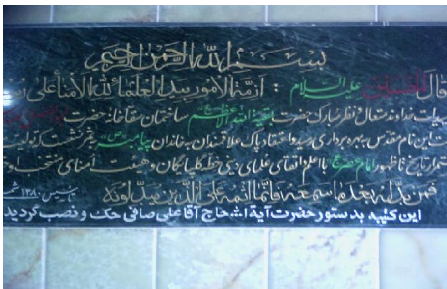
تصویر شماره ۷- کتیبه ورودی عباسیه

در طبقه اول عباسیه مَشکی برنزی به همراه سپر و شمشیری روی پایه ای برنزی نصب شده است که نمادی از مشک حضرت ابوالفضل است. (تصویر شماره ۸) این طبقه دارای کاشی کاری هایی است که مزین به آیات قرآنی و نام ائمه علیهم السلام است. در دو طرف این طبقه نقشی از بین الحرمین وجود دارد. کف بنا با سنگ های مرمر و فرش های یکدست مفروش است. هنگام ورود به این طبقه بوی خوش گلاب استشمام می شود که از گلاب مرغوب کاشان است که برای شست و شوی کاشی های مزین به آیات قرآن از آن استفاده می شود.