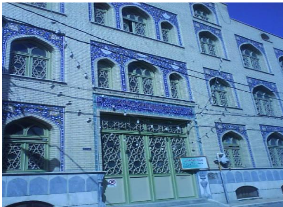
تصویر شماره ۶- نمای بیرونی عباسیه

در طبقه اول عباسیه مَشکی برنزی به همراه سپر و شمشیری روی پایه ای برنزی نصب شده است که نمادی از مشک حضرت ابوالفضل است. (تصویر شماره ۸) این طبقه دارای کاشی کاری هایی است که مزین به آیات قرآنی و نام ائمه علیهم السلام است. در دو طرف این طبقه نقشی از بین الحرمین وجود دارد. کف بنا با سنگ های مرمر و فرش های یکدست مفروش است. هنگام ورود به این طبقه بوی خوش گلاب استشمام می شود که از گلاب مرغوب کاشان است که برای شست و شوی کاشی های مزین به آیات قرآن از آن استفاده می شود.