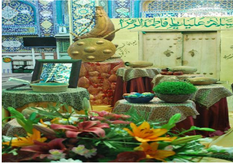
تصویر شماره ۱۲- اجرای برنامه های مختلف به مناسبت تحویل سال