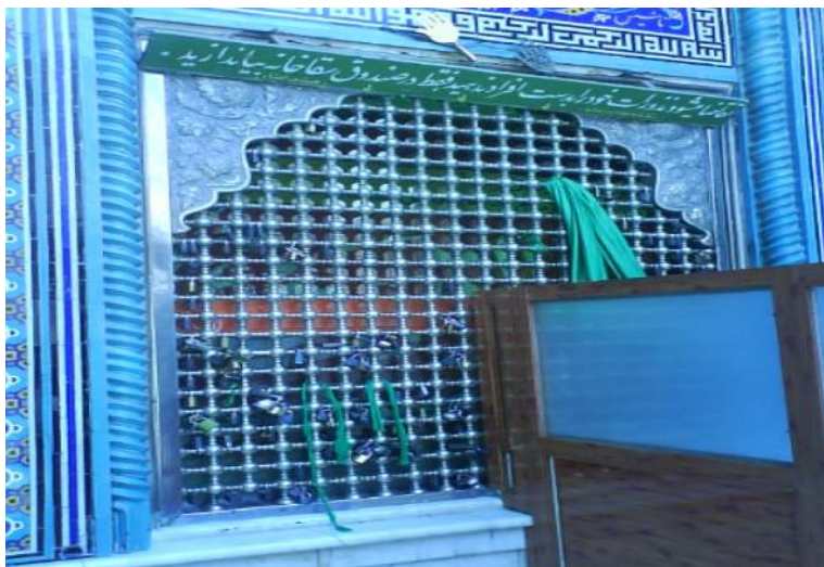
تصویر شماره ۱- نمایی از پنجره فولاد

سقاخانه حضرت ابوالفضل در سایه کرامات ایشان و توجه ویژه مردم به آن، با گذشت زمان توسعه یافت و به سفارش هیات امناء، در سال ۱۳۷۱، پنجره ای توسط هنرمند اصفهانی مرحوم حسین پرورش ساخته شد و جلوی سقاخانه نصب گردید و مردم نیز برای برآورده شدن حاجات خود نذورات نقدی را درون پنجره می ریختند. (تصویر شماره ۱) داخل این پنجره پرچمی به رنگ قرمز، با عبارت یا قمر بنی هاشم به چشم می خورد که مربوط به بارگاه حضرت ابوالفضل در کربلاست.