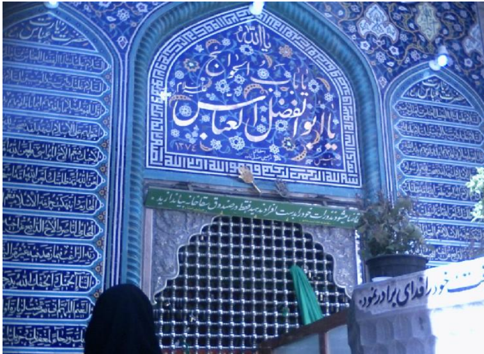
تصویر شماره ۲- نمایی از کاشی کاری سقاخانه

چاه آب در قسمت مرکزی سقاخانه قرار گرفته است که مردم در گذشته به نیت شفا و برآورده شدن حاجات خود از آب آن می نوشیدند. به دلیل گسترش شهرنشینی و آلوده شدن آب های زیرزمینی، استفاده از آب چاه متوقف شد و در مکان چاه، آبناهی سنگی قرار گرفت و از آب لوله کشی برای تامین نیاز آب شرب زائرین استفاده گردید. این آبنا به سفارش سقاخانه در سال ۱۳۸۸ توسط هنرمندان اصفهانی ساخته شد و در این مکان نصب گردید. این آبنا شامل شش خروجی شیر آب است که اکنون چهار شیر آن مورد استفاده است (دو شیر در قسمت خواهران و دو شیر در قسمت برادران). در بالای آبنا، مَشکی سنگی به نماد مشک حضرت عباس قرار دارد. با وجود اطلاع مردم از لوله کشی بودن این آب، اعتقاد آن ها به شفا بخش بودن و متبرک بودن آن حفظ شده است. (تصویر شماره ۳)