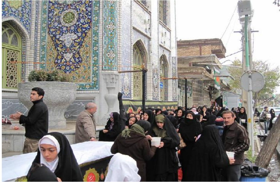
تصویر شماره ۵- حضور پرشکوه مردم هنگام مراسم