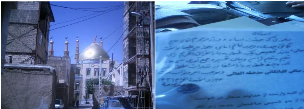
تصویر شماره ۱۰- تایید ساخت دارالشفاء و دارالقرآن از سوی آیت الله صافی گلپایگانی تصویر شماره ۱۱- مراحل ساخت و تکمیل دارالشفاء

از آن جا که اعتبارات دولتی جوابگوی نیازهای درمانی مردم نیست، لذا برای تامین این نیازها بخش خصوصی باید وارد عمل شود به همین منظور به هیئت امنای سقاخانه، تاسیس یک آزمایشگاه مجهز در دارالشفاء، پیشنهاد داده شد که مورد موافقت قرار گرفت. همچنین تصمیم گرفته شد که هزینه های آزمایشگاه بر اساس تعرفه های دولتی باشد که یک دهم تعرفه های خصوصی است و این باعث می شود تا هزینه های درمانی مردم کاهش یابد.