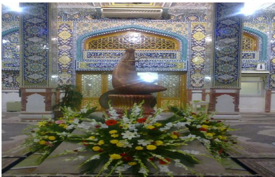
تصویر شماره ۸-مشک برنزی درون عباسیه

طبقات دیگر با راه پله و آسانسور به یکدیگر متصل می شوند. در قسمتی از طبقات فوقانی مشک برنزی که در مرکز طبقه اول وجود دارد قابل مشاهده است. این طبقات کاشی کاری ها و گچ بری های ساده تری نسبت به طبقه اول دارند. بخشی از این طبقات قرار است در آینده به موزه و کتابخانه عباسیه اختصاص داده شود. این موزه قرار است محل نگهداری هدایای مردمی به سقاخانه باشد. طبق گفته هیات امناء، مردم هدایایی را به این موزه اختصاص داده اند که با توجه به کامل نبودن محل موزه از قبول این اشیاء خوداری می شود. با این وجود سماور مطالایی، هدایی از سوی پیرزنی وجود دارد که درون پنجره فولاد سقاخانه از آن نگهداری می شود.