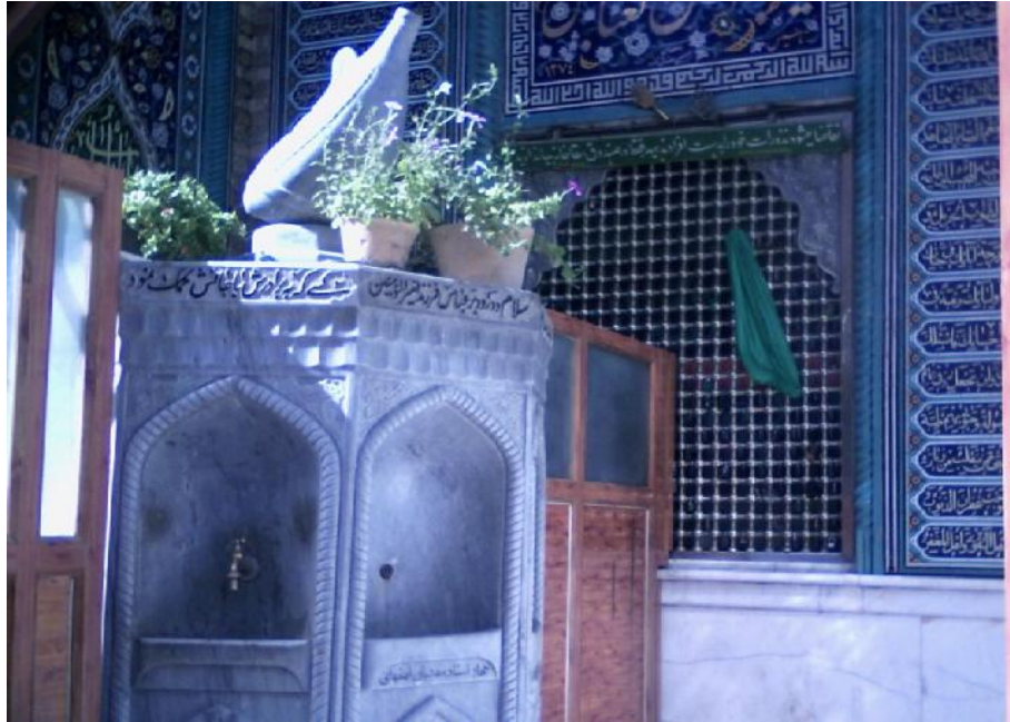
تصویر شماره ۳- نمایی از آبناهی سقاخانه